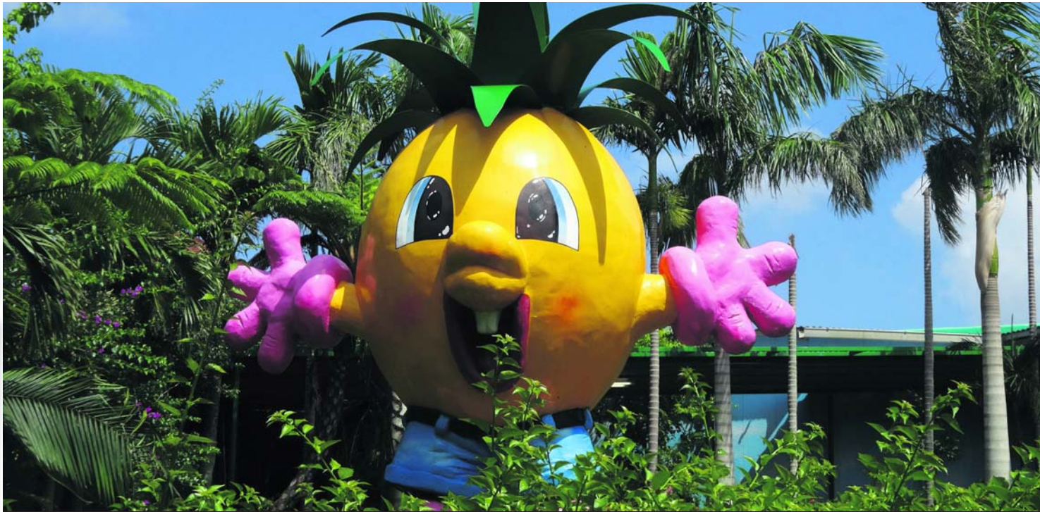
Alles is ananas in het Japanse Ananas Pretpark. / DAAN KRIEKE

Doe mee! Download de Scoop-shot app op je telefoon en verdien geld met je foto's.