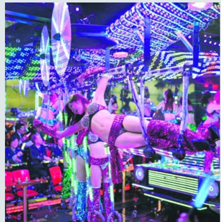
Dansers geven een show in het epileptische Robot Restaurant.

alleen voor een drankje terecht kunt. Bars - die geen bars, maar behandelingen in een schoonheidssalon blijken te zijn. En het woord 'themapark' is ook ruim interpreteerbaar. METRO