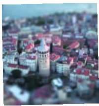
Istanbul, Turkije, Fehim Eren

Scoopshot wereldwijd Metro plaatst elke week foto's uit wereldsteden, gemaakt door Scoopshooters ter plaatse.