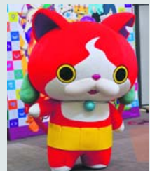
Jibanyan, een populair mangakarakter, is slechts één van de vele, vele animatiefiguurtjes die de straten van Tokio afstruinen.

Japan is een vreemd land vol uitersten en tegenstellingen. Ze hebben er high tech snelle treinen, maar ook computers en kantoorsettingen die uit de jaren '70 lijken te stammen. Op de straten van Tokio weet je van gekkigheid niet waar je moet kijken door alle animatiefiguurtjes, maffe shows, extravagante kleding en gekleurde neonlichten, terwijl de Japanners zelf juist enorm behouden en bescheiden zijn. Ook vreemd; ze noemen veel dingen het één en dan blijkt het iets anders te zijn. In Tokio is er bijvoorbeeld het epileptische Robot Restaurant een show. Cafés die op hun beurt (zelfs chique) restaurants blijken te zijn, en waar je ook helemaal niet